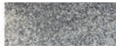
EcoDraining Gris Acier